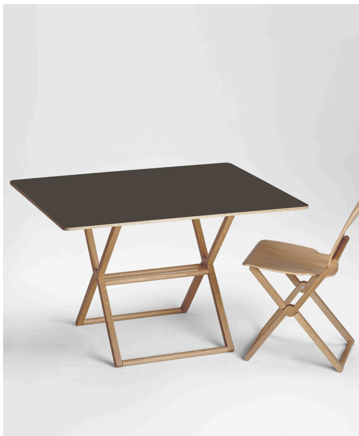
Table with folding frame in solid beech, oak or walnut. Plywood lacquered top in white RAL9016, gray RAL7044, dark gray RAL7022 and cement gray RAL 7033.

Tavolino con struttura pieghevole in legno massello di faggio, rovere o noce canaletto. Piano in multistrato laccato bianco RAL9016, grigio RAL7044, grigio scuro RAL7022 e grigio cemento RAL 7033.