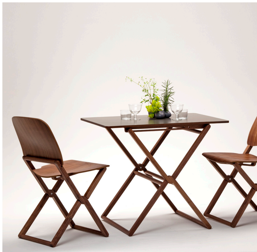
Table with folding frame in solid beech, oak or walnut. Plywood lacquered top in white RAL9016, gray RAL7044 or dark gray RAL7022, cement grey RAL7033.

Tavolino con struttura pieghevole in legno massello di faggio, rovere o noce canaletto. Piano in multistrato laccato bianco RAL9016, grigio RAL7044 o grigio scuro RAL7022, verde salvia RAL7033.